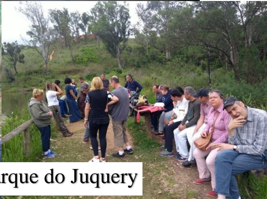
Parque do Juquery