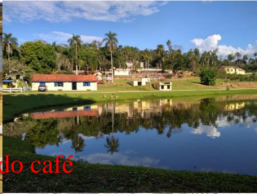
Fazenda do café