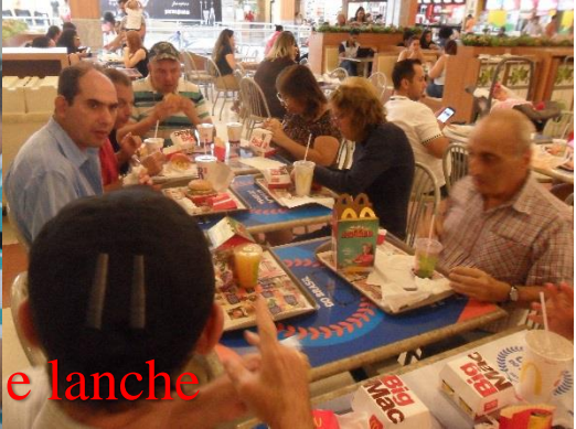
Cinema e lanche