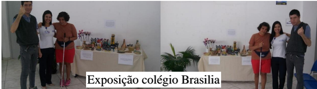
Exposição colégio Brasília