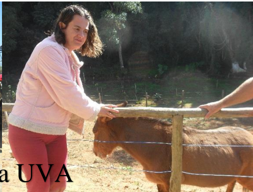
Festa da UVA