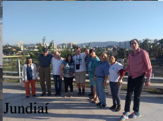
SESC - Jundiaí