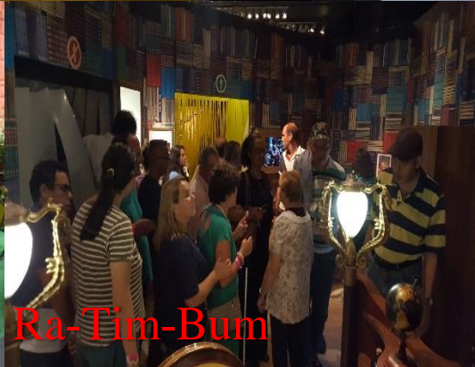
Exposição Castelo Ra-Tim-Bum